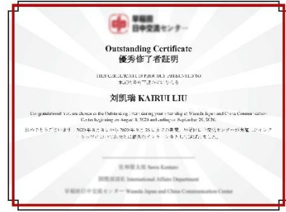
优秀实习生证明（日英双语）