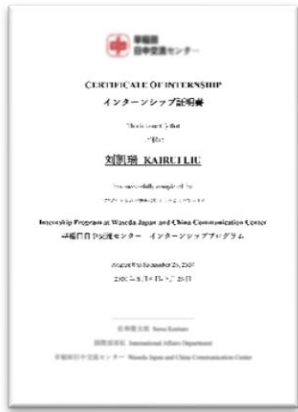
实习证明（日英双语）