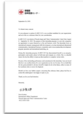
实习推荐证明信（英文）