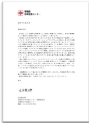
实习推荐证明信（日文）